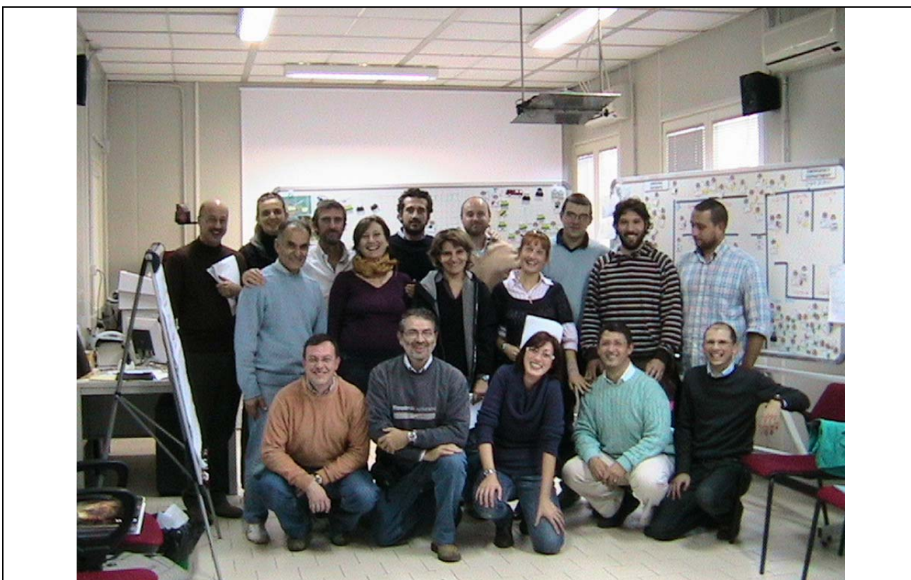
Partecipanti ed istruttori del corso Senior Instructor Emergo Train del 20 ottobre 2008

Nel 2008, presso il centro GECAV dell'AUSL di Bologna si sono già tenuti due corsi per Senior Instructor Emergo Train System: uno a febbraio, al momento dell'acquisizione della licenza regionale ETS, ed uno in ottobre, portando a 30 il numero di Senior Instructors Emergo Train in Italia.