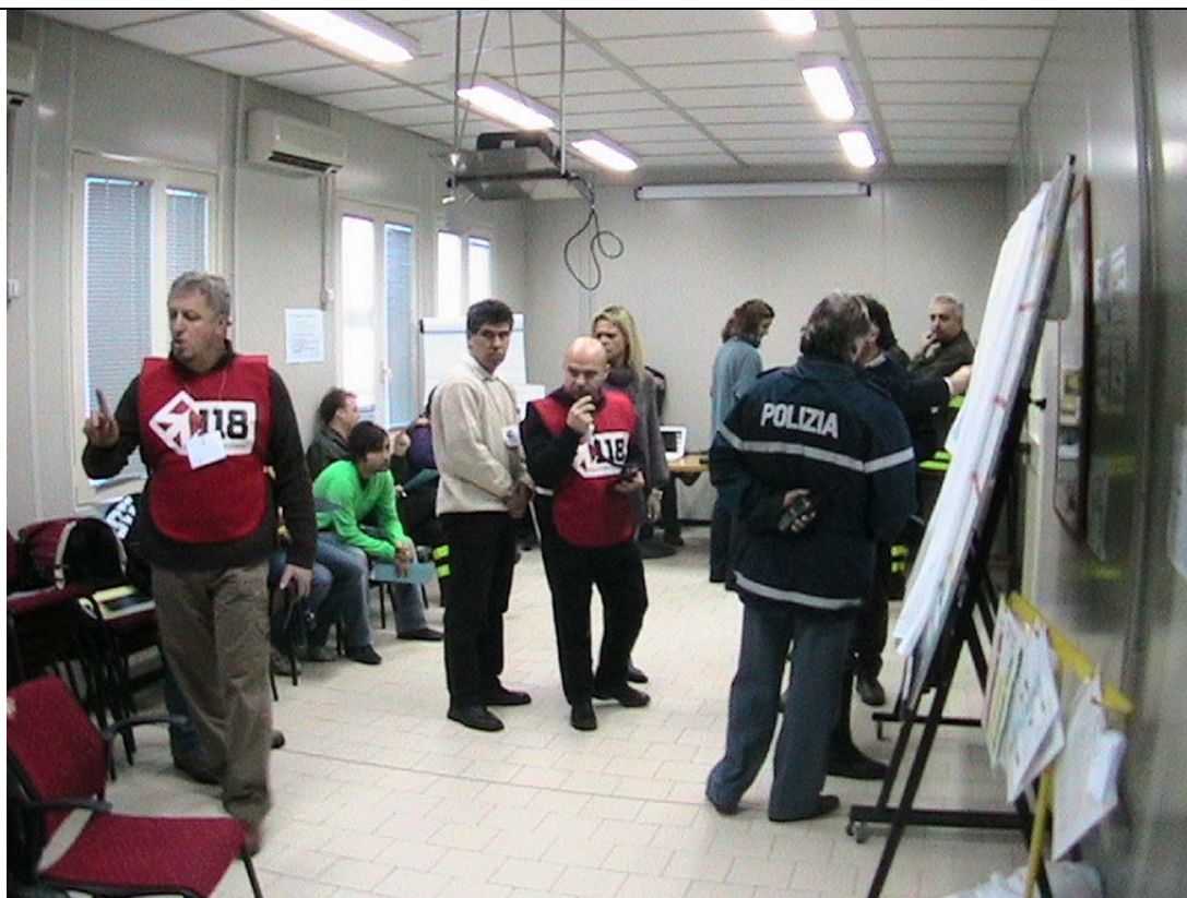
Simulazione Emergo Train System durante un corso LISA

La metodologia Emergo Train System è stata usata per realizzare i corsi di formazione interforze sulle Linee di Intervento Sanitario in Autostrada (L.I.S.A.) rivolti a creare sinergie operative tra personale del 118, Pubbliche Assistenze e Croce Rossa, Polizia Stradale, Vigili del Fuoco e Autostrade per l'Italia SpA nell'ambito di un programma regionale dedicato alla riduzione del rischio sulle vie di grande comunicazione che attraversano l'Emilia-Romagna.